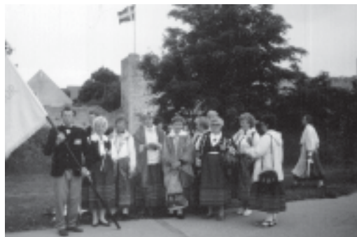
Põhjamaade Koorifestivalil Gotlandil 1997.a. Pildile on jäänud osa koorist.

Eestimaal Tartu laulupeod, Põhja-Eesti, Saaremaa, kauged paigad Venemaal, Tõehhimaa, Poola. Alatiseks jääb meelde Põhjamaade koorifestival Gotlandil. Eelmisel suvel kõlasid