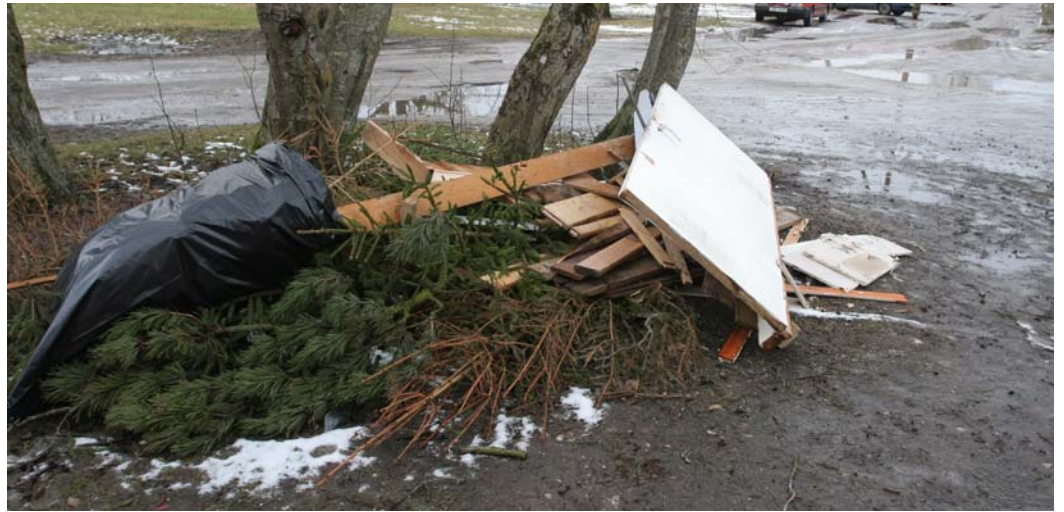
Korraldatud või mitte?

Ragn-Sells lepingul on kaasas jäätmete äraveol